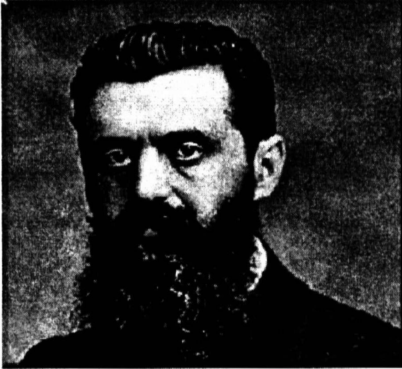
Theodor Herzl, osnivač cionizma i suradnik na stvaranju "Protokola".